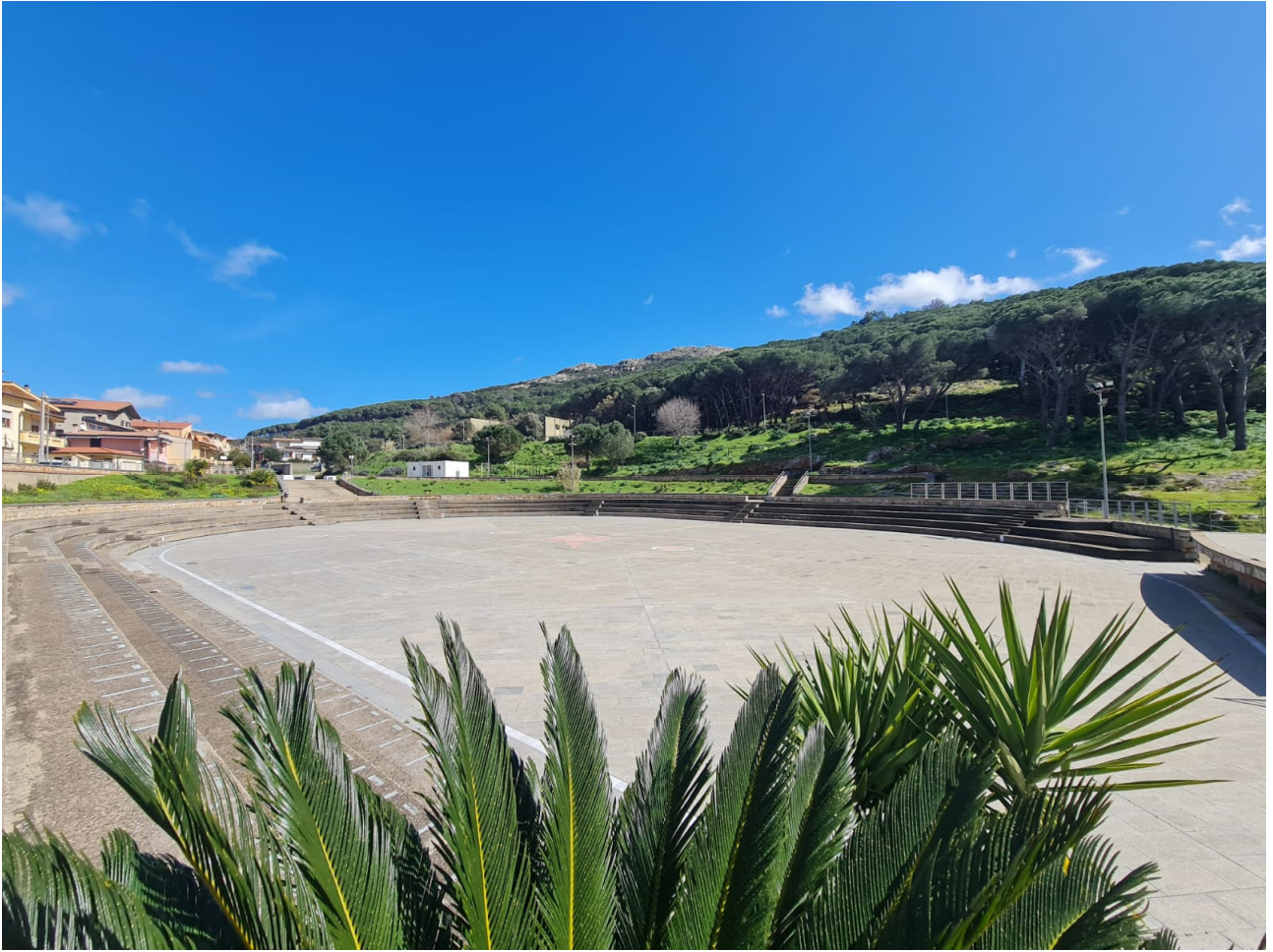
Vista Prospettica Area Pubblica Rio Salixi