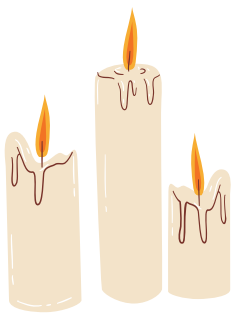
SA MITZA DE LUTZIFERU